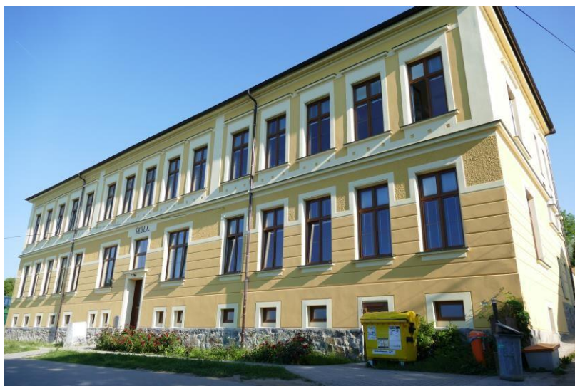
Budova školy v nové fasádě