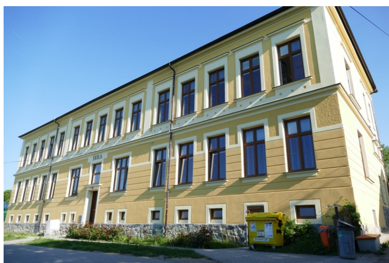
Budova školy v nové fasádě